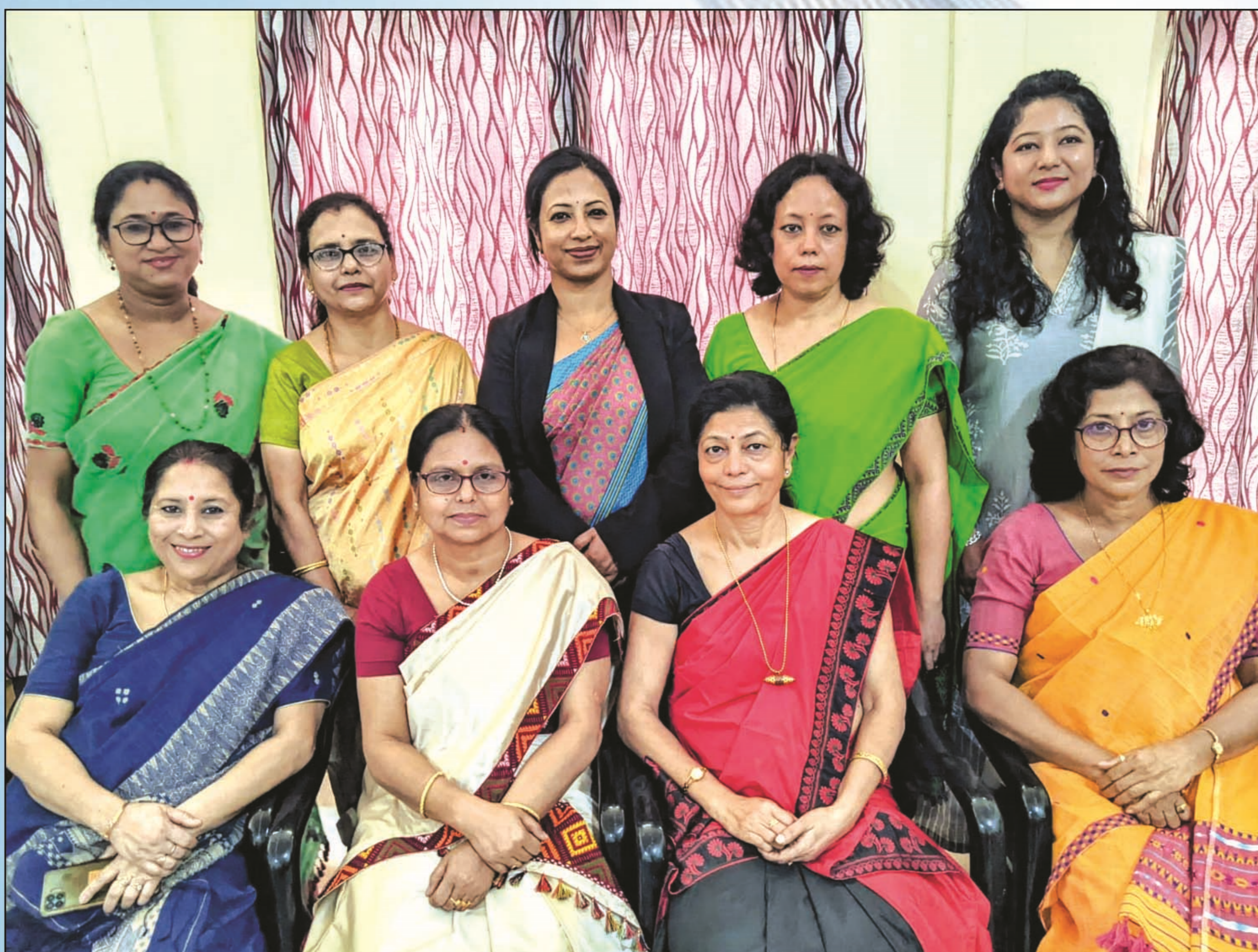
A few members of Executive Body of B. Borooah College Women's Forum